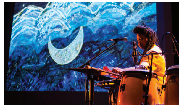
DJ Maclarnaque en concert

Programme disponible sur nos sites internet.